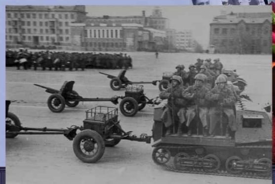
Артиллерия на параде 1941 года в Куйбышеве