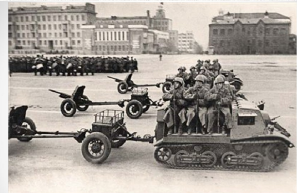
Будущая армия Победы была сформирована по директиве Ставки Верховного главнокомандования от 2 ноября, как 60-я резервная.