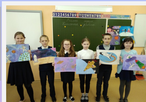
Рисунки ко Дню космонавтики