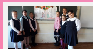
В День пожилого человека