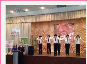
Концерт к 8 марта