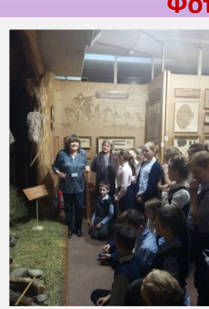
В краеведческом музее