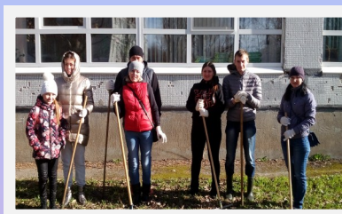
С родителями на субботнике