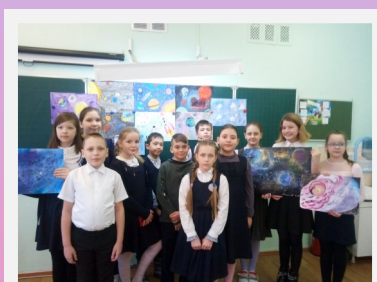
В День космонавтики