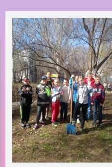
Акция «Чистый город»