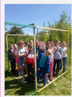
Поездка на ранчо