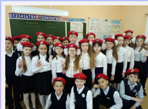
К «Зарнице» готовы