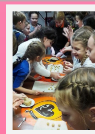
Все в шоколаде